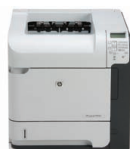
Imprimante HP LaserJet P4515n